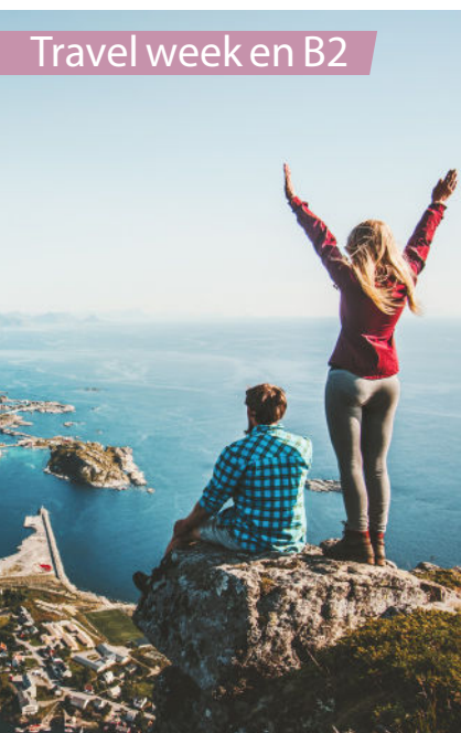
Travel week en B2