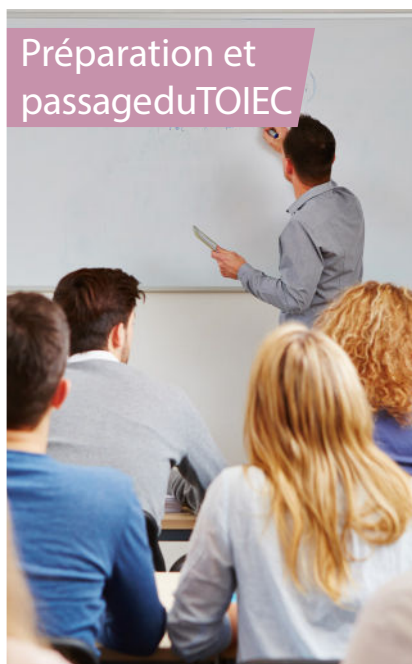
Préparation et passage du TOIEC