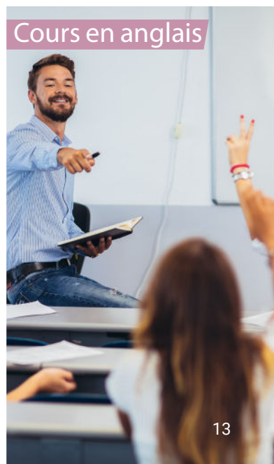
Cours en anglais